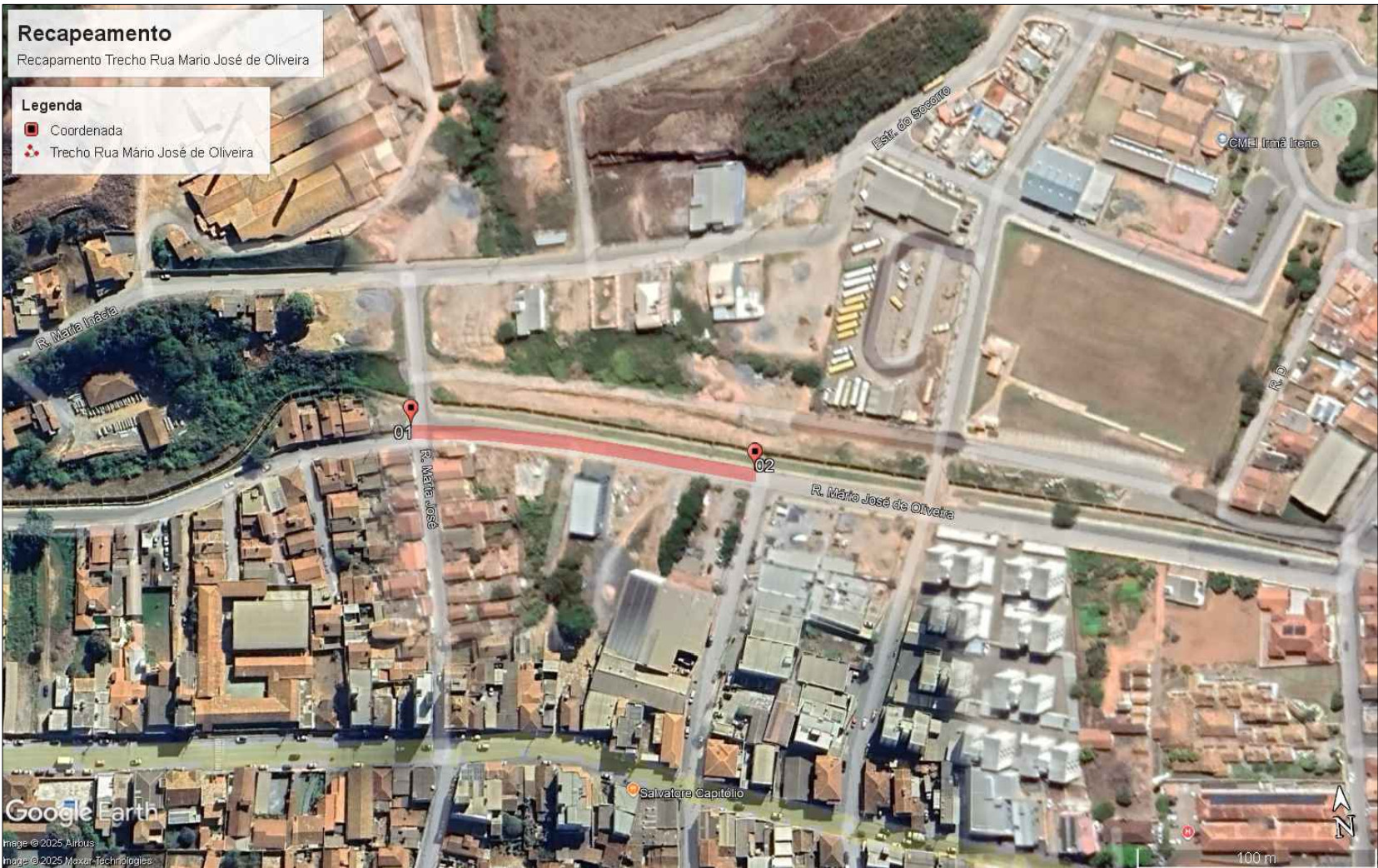
LOCALIZAÇÃO PASSEIO -TRECHO RUA MARIO JOSE DE OLIVEIRA SEM ESCALA